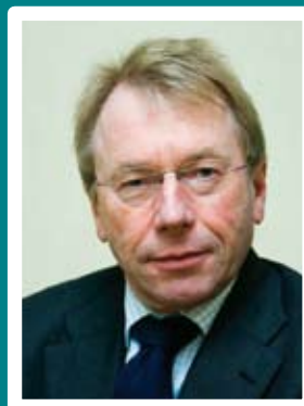
Global oppvarming - næringslivets store muligheter og ansvar

Kåre Willoch, tidligere statsminister og med i "Besteforeldre for ansvarlig klimapolitikk"